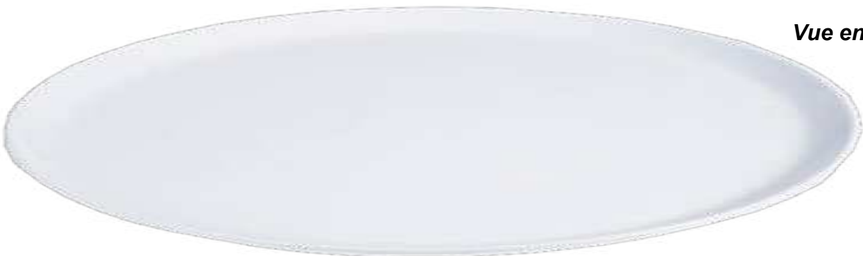
Vue en volume