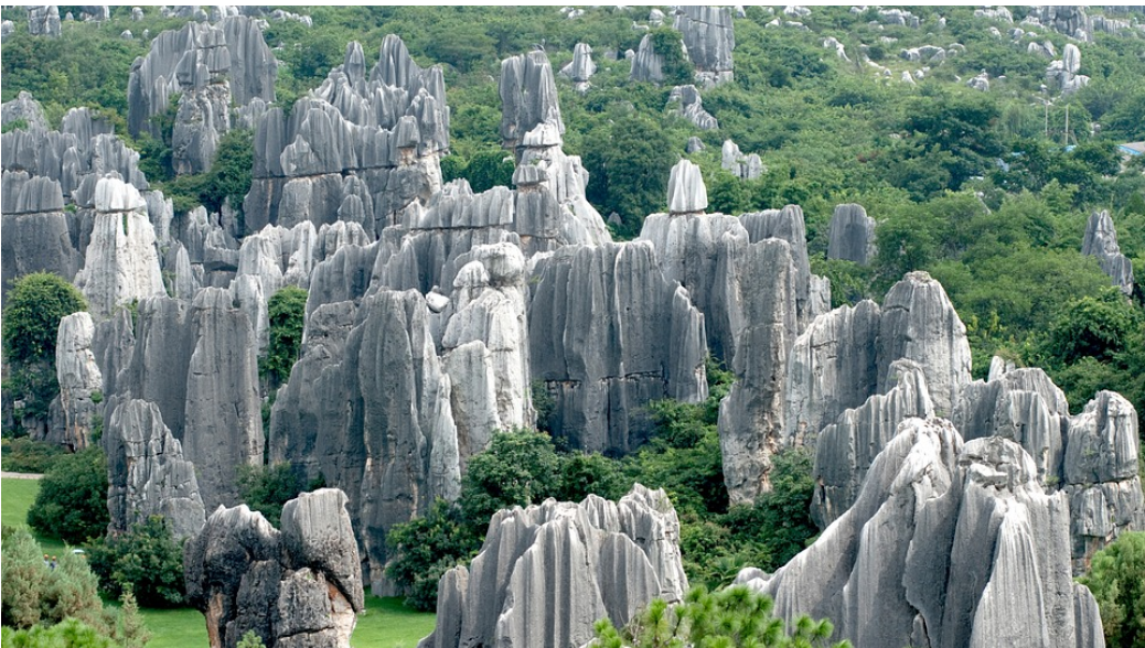
Forêt de pierres en Chine dans la province de Hunan.