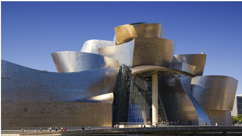
Musée Guggenheim à Bilbao de Frank Gehry