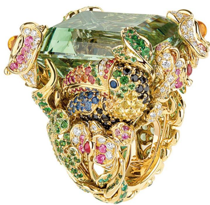
Victoire de Castellane : Collection Dior

La créatrice de bijoux de luxe Victoire de Castellane fait appel à vos talents pour organiser le dîner de lancement de sa nouvelle collection. Elle vous demande de vous inspirer de ses créations pour le dressage à l’assiette, d’un plat végétarien.